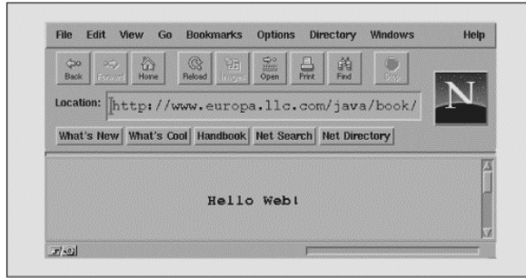
شکل (۳-۷) خروجی یک اپلت نمونه در محیط مرورگر

import java.awt.*; import java.lang.*; import java.io.*; import java.applet.*; // This program illustrates a simple applet with a TextField, // Panel, Button, Choice menu, and Canvas. public class Example1 extends Applet { TextField tf; DrawCanvas c; Button drawBtn; Choice ch; // Add the Components to the screen.. . public void init() { // Set up display area... resize(300,200); setLayout(new BorderLayout()); // Add the components... // Add the text at the top. tf = new TextField(); add("North",tf); // Add the custom Canvas to the center c = new DrawCanvas(this); add("Center",c); // Create the panel with button and choices at the bottom... Panel p = new Panel(); drawBtn = new Button("Draw Choice Item"); p.add(drawBtn);